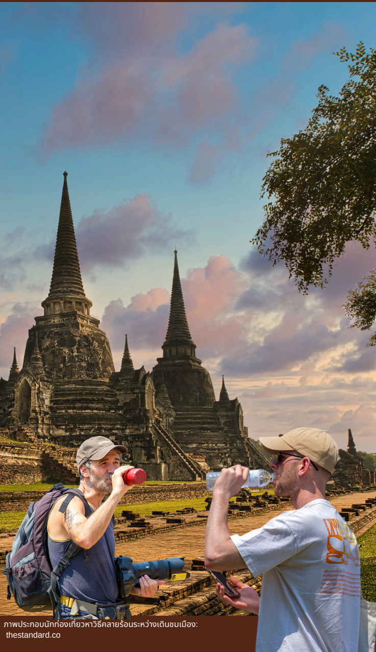
ภาพประกอบนักท่องเที่ยวหลายร้อยระหว่างเดินชมเมือง

ภาพประกอบอากาศร้อนจัด