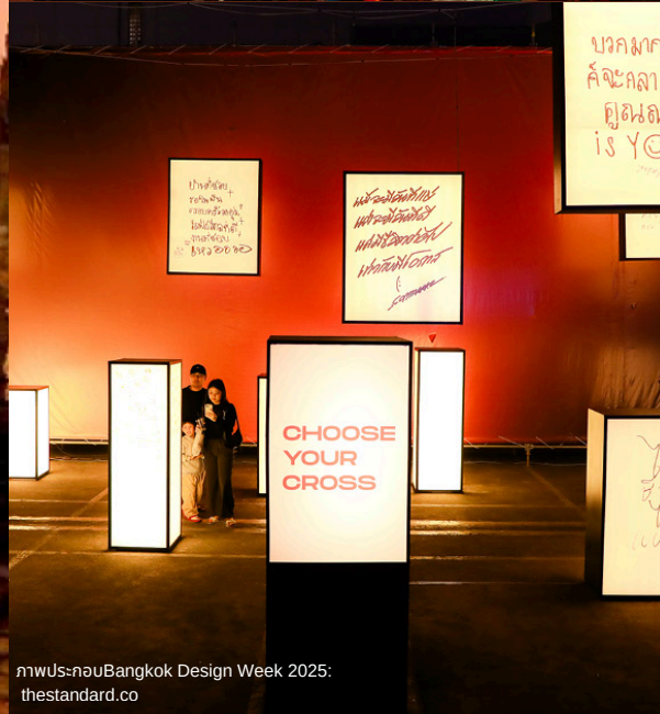
ภาพประกอบBangkok Design Week 2025