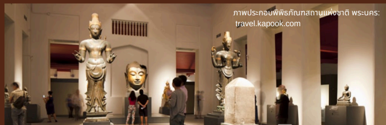
ภาพประกอบพิพิธภัณฑสถานแห่งชาติ พระนคร

กรมศิลปากร ได้เปิดให้นักท่องเที่ยวสัมผัสความงดงามของโบราณสถานวังหน้า และชมห้องจัดแสดงนิทรรศการภายในพิพิธภัณฑสถานแห่งชาติพระนคร กรุงเทพมหานคร และเปิดให้เยี่ยมชมเครื่องทองสมัยอยุธยาที่สวยงาม และมีจำนวนมากที่สุดของประเทศไทย ณ พิพิธภัณฑสถานแห่งชาติเจ้าสามพระยา จังหวัดพระนครศรีอยุธยา ยามค่ำคืน 7