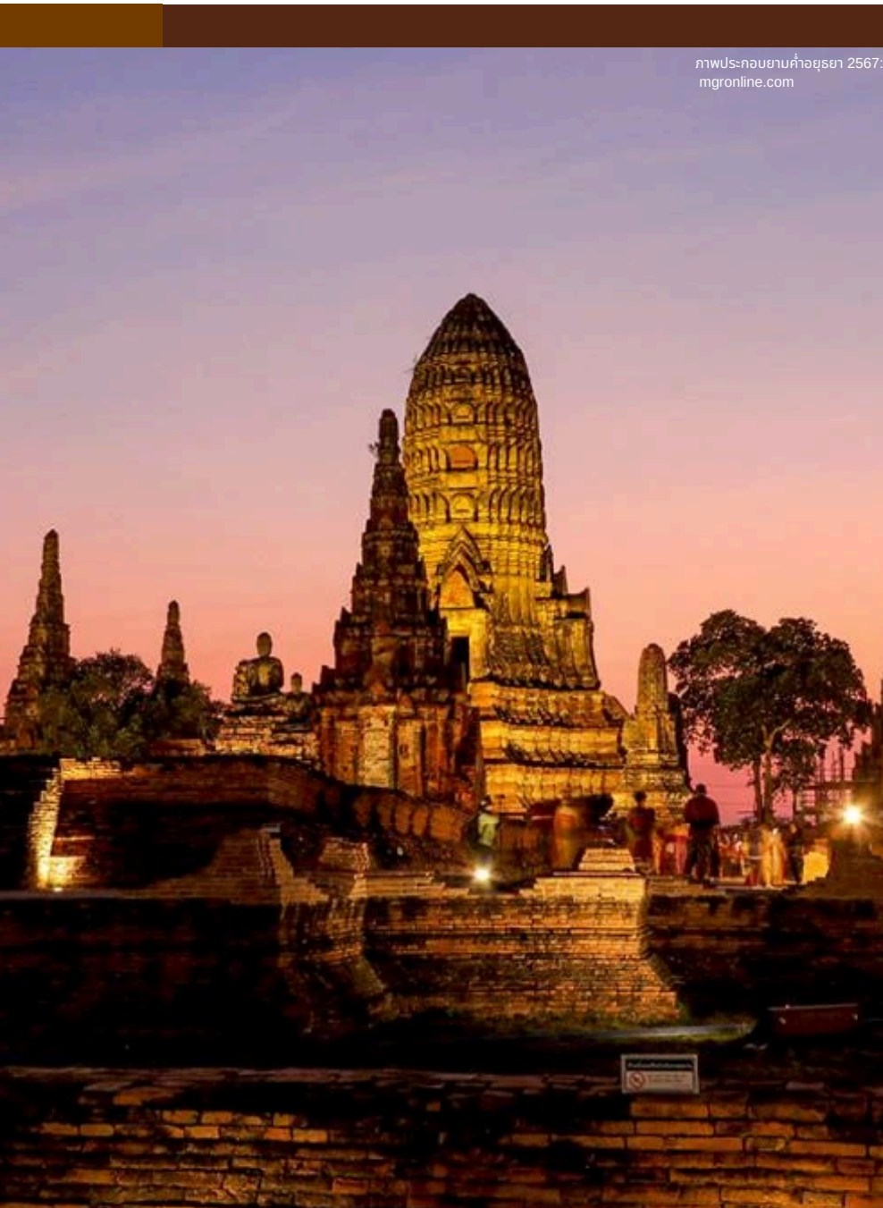
ภาพประกอบยานคำอูรธา 2567

Glow Up : คั้นชีวิตให้ไนท์ไลฟ์ในโลกที่เปลี่ยนไป