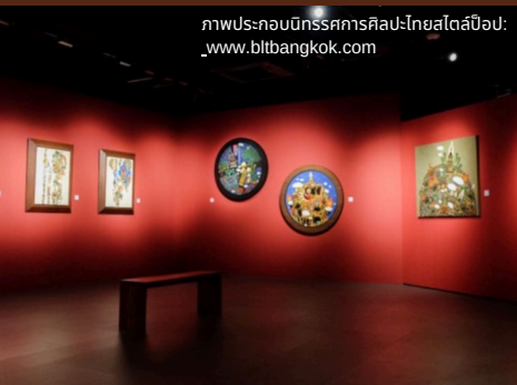
ภาพประกอบนิทรรศการศิลปะไทยสตูดิโอ