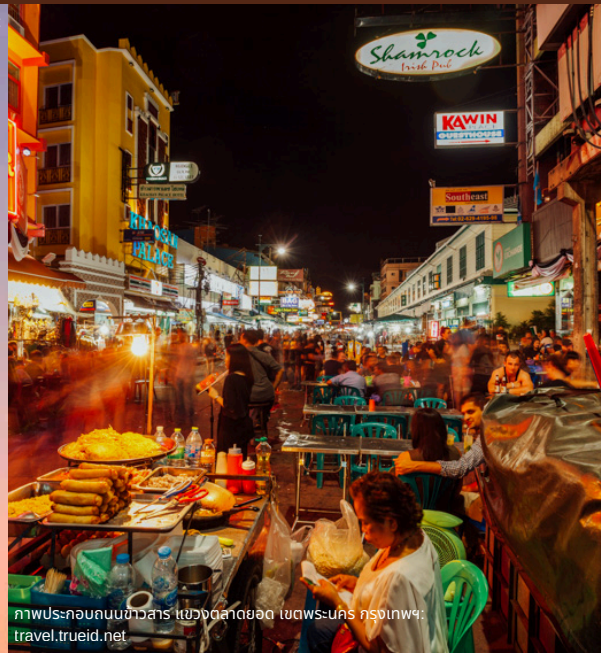
ภาพประกอบถนนข้าวสาร แขวงตลาดยอด เขตพระนคร กรุงเทพฯ