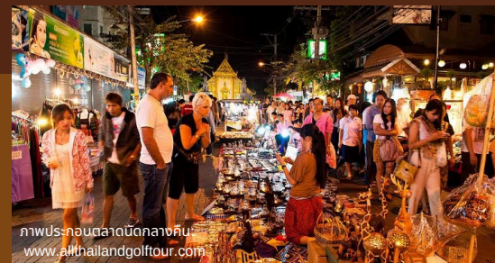
ภาพประกอบตลาดนัดกลางคืน

ลดผลกระทบต่อระบบนิเวศในช่วงกลางวัน ส่งเสริมการใช้ทรัพยากรอย่างคุ้มค่า และสามารถเชื่อมโยงกับแนวทาง Low Carbon Tourism ผ่านการใช้พลังงานทางเลือก เช่น ระบบไฟฟ้าจากพลังงานแสงอาทิตย์