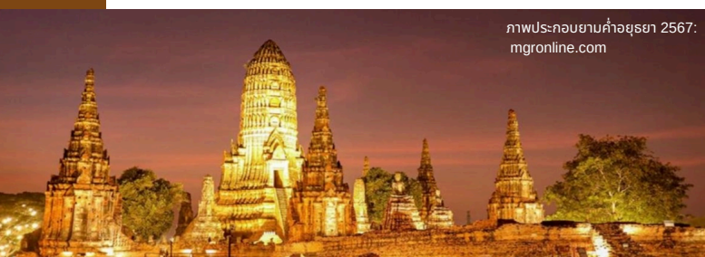
ภาพประกอบยามค่ำอยุธยา 2567

จังหวัดพระนครศรีอยุธยาเป็นตัวอย่างสำคัญของการพัฒนา “ไนท์ไลฟ์” ให้สอดคล้องกับอัตลักษณ์ท้องถิ่น โดยการเปิดให้นักท่องเที่ยวเยี่ยมชมสถานที่ท่องเที่ยวทางประวัติศาสตร์และวัฒนธรรมระดับโลก ยามค่ำคืน ได้แก่ วัดพระราม วัดพระศรีสรรเพชญ์ วัดราชบูรณะ และวัดมหาธาตุ ที่ผสมผสานบรรยากาศจากการประดับไฟ การแสดงศิลปวัฒนธรรม ล้อมวงเล่า และสาธิตหัตถกรรมพื้นบ้านเข้าไว้ด้วยกันอย่างกลมกลืน เพื่อให้นักท่องเที่ยวได้สัมผัสกับการท่องเที่ยวที่แตกต่างจากวิถีเดิมในช่วงกลางวัน และเป็นการสร้างมูลค่าเพิ่มให้กับเศรษฐกิจจังหวัดพระนครศรีอยุธยา 6