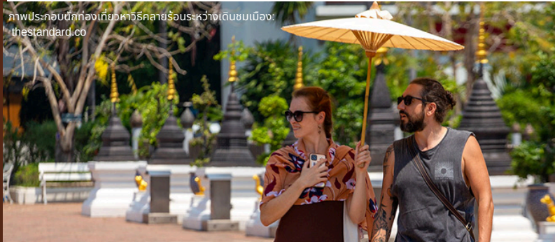
ภาพประกอบนักท่องเที่ยวหลายร้อยระหว่างเดินชมเมือง

3 : Spring News. (2566, 14 ธันวาคม). 14 จังหวัด เตรียมตัวรับมือ “อากาศร้อนจัด” มีโอกาสอุณหภูมิสูง 42°C.