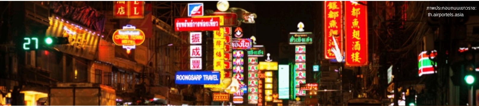
ภาพประกอบถนนเยาวราช: th.airportels.asia

NOCTOURISM หรือ “การท่องเที่ยวยามค่ำคืน” เป็นเทรนด์การท่องเที่ยวที่กำลังได้รับความนิยมและมาแรงในปี 2025 4 โดยคำว่า NOCTOURISM เกิดจากการผสมคำระหว่าง “NOCTURNAL” ซึ่งหมายถึง ที่ออกหากินยามค่ำคืน และคำว่า “TOURISM” ที่หมายถึง การท่องเที่ยว รวมกันแล้วจึงหมายถึงการออกไปทำกิจกรรมหรือหาประสบการณ์การเดินทางในช่วงเวลากลางคืน 5 ตอบโจทย์สำหรับกลุ่มนักท่องเที่ยวที่ต้องการหลีกเลี่ยงแสงแดดและอากาศที่ร้อนอบอ้าวในตอนกลางวัน และต้องการการเปิดประสบการณ์ใหม่ในการได้สัมผัสความสวยงามในมุมมองที่แตกต่างออกไปตั้งแต่การเดินชมเมือง ช้อปปิ้งตลาดกลางคืน ลิ้มรสอาหารท้องถิ่น ล่องเรือชมวิวแม่น้ำ คอนเสิร์ต ไปจนถึงการท่องเที่ยวเชิงธรรมชาติ อย่างการดูดาวหรือการตั้งแคมป์ในพื้นที่อุทยาน เทรนด์ดังกล่าวจึงไม่เพียงช่วยลดข้อจำกัดด้านสภาพอากาศ แต่ยังช่วยกระตุ้นเศรษฐกิจ เพิ่มความยืดหยุ่นในภาคการท่องเที่ยว และเพิ่มรายได้แก่ผู้ประกอบการด้วย ทั้งนี้ ต้องคำนึงถึงความปลอดภัยเป็นสำคัญ และกิจกรรมต้องไม่สร้างผลกระทบต่อสังคมและสิ่งแวดล้อมโดยรอบ