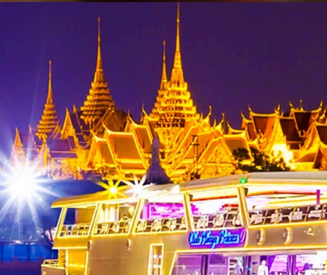
ภาพประกอบล่องเรือแม่น้ำเจ้าพระยากลางคืน